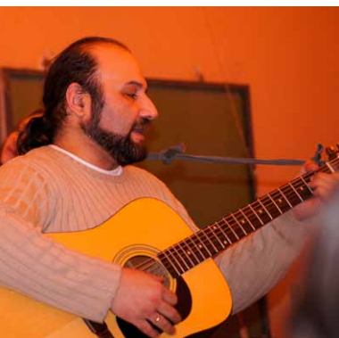
▲ Александр Левкоев до сих пор на сцене